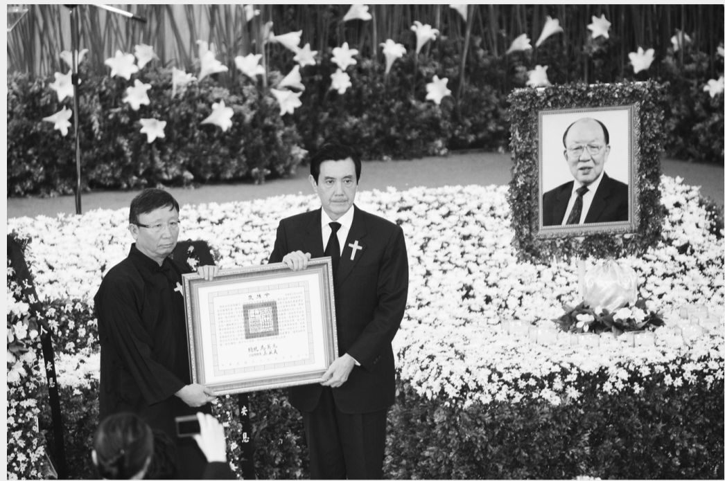
馬英九總統蒞臨本校董事會宋時選先生追思會現場

被譽為「青年之導師」的宋時選先生，於四月十八日仙逝。享年九十。定於五月八日上午，在台北市新生南路衛理堂公祭。宋公是虔誠的基督徒。我認識宋公，是他擔任救國團主任秘書的時候。他是經常與青年站在一起和生活在青年救國團工作有關係。經國先生知道他是一個非常隨和，愛護青年的人，所以才要他在救國團做事也說不定。 後來他轉任動員群眾輔導選舉的黨務工作，曾任中國國民黨台灣省部主任委員，和中央黨部組織工作會主任。他擔任省黨部主委時，有一天早上，突然前往視察南投縣極為偏僻的一個民眾服務站。這個民眾服務站不要說省黨部主委，連縣黨部主委也沒有去過。