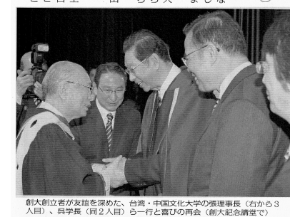
創價大學池田會長與張鏡湖、池田、中國文化大學張鏡湖董事長（左起爲三人）、與學長一行二日與池田會長（右起張鏡湖）

「教育の世紀」「環境の世紀」「生命の世紀」へ！ 教育への情熱と、台湾・日本の多様な文化交流、さらに地球環境の未来を語る 第三文明社