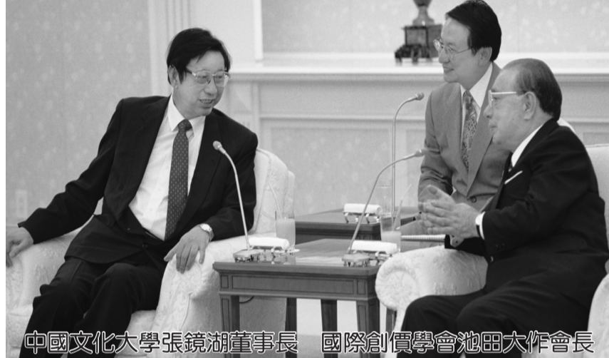
中國文化大學張鏡湖董事長 國際創價學會池田大作會長