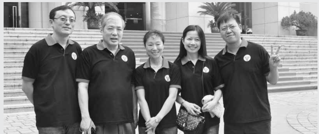
海峽兩岸青年建築師研習營成員合影。

《文大校訊》為您掌握校園動態。歡迎前往曉風紀念館資訊中心八樓、圖書館櫃檯或大雅館、大慈館櫃檯索取。