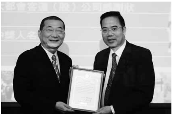
大都會客運與華岡二度聯手再推出相搭約搭公車

【文 / 李文瑜】送給新生及文化大學的學生一份開學大禮物，即日起本校與大都會客運公司及悠遊卡公司再次合作辦理「文化大學學生相約搭公車活動」，有助於用心鼓勵文化大學學生多搭乘大眾運輸工具，以降低騎乘機車，減少學生發生交通事故機會，同時鼓勵學生們響應節減碳愛地球，減少汽、機車燃油廢氣排放，享受自然好空氣。