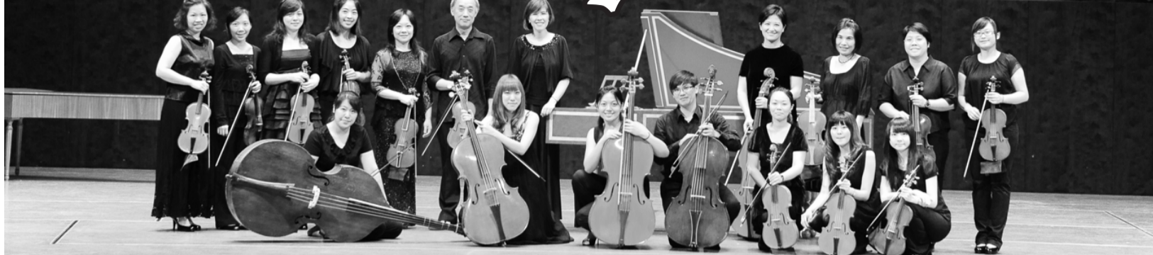
藝術學院之巴洛克樂團 20日在國家音樂廳演出盛況