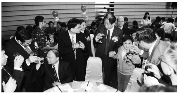
吳校長歡迎校友回母校