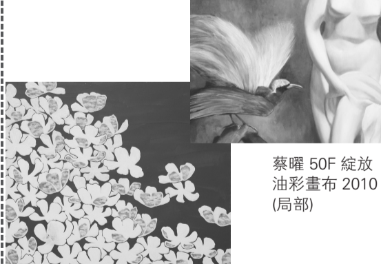
沈千微 20F 解脫 壓克力畫布