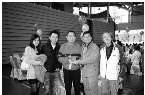
知名藝人趙舜學長參加校友節