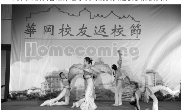
舞蹈系校友率子弟兵為華岡獻舞