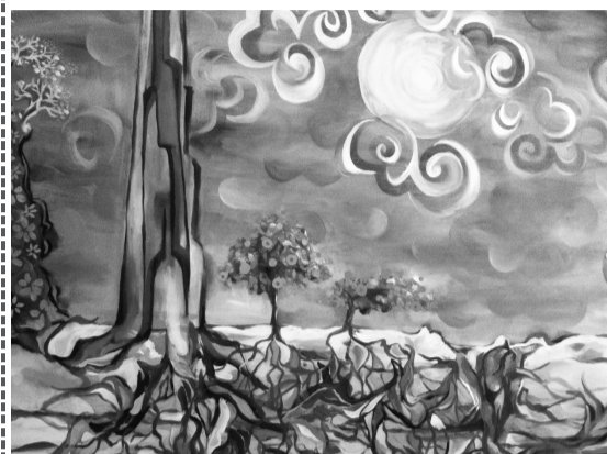
黃子于 50F 理想國 油彩畫布

黃子于 黃羿愷 朱靖天 蔡曜 莊凱評 陳仲揚 沈千微 開幕時間：2010/11/17 星期三 十三點鐘地點：文化大學華岡博物館1F 地址：台北市士林區華岡路55號(原華岡書局)每週六下午兩日休館