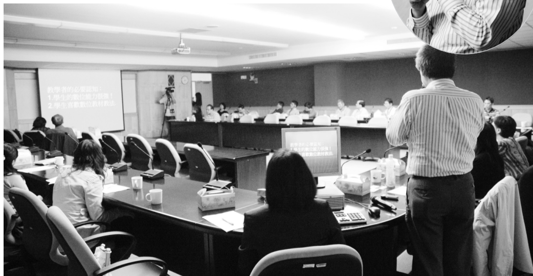
開發數位優質教材獲老師關注參與，何宏發教授談數位課程之優點