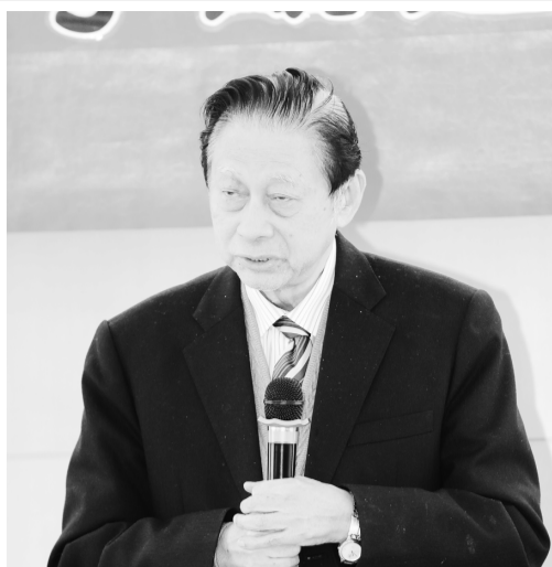
張董事長重視孔學教育