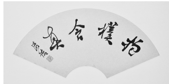
蔡清德 《抱樸含真》 行書扇面

場地：台北市國父紀念館翠溪藝廊 時間：2011年3月9日至2011年3月20日 開幕儀式：2011年3月12日下午3點