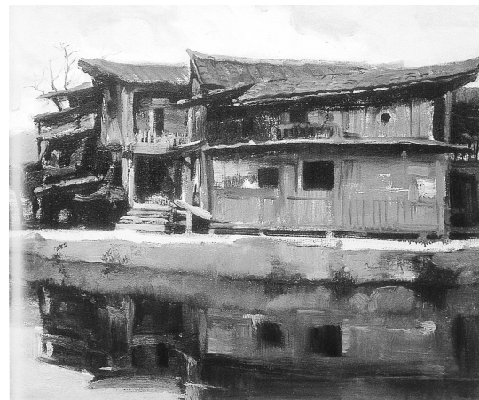
李豫閩 《雙溪老屋》 油畫 50x60cm