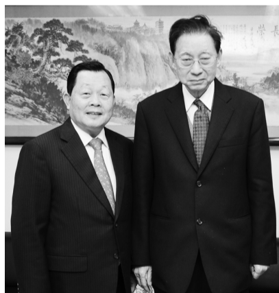
苗栗縣長劉政鴻拜訪張董事長與吳校長談企業之營之道

【文/李文瑜】苗栗縣舉辦民國一百年台灣燈會創下破表的參觀人次奇蹟，帶動苗栗縣觀光人潮，寫下歷史奇蹟的縣長劉政鴻特別應商學院國企所邱毅老師邀請與華岡學生對話演講。劉政鴻縣長說，我來自鄉下，靠著一股鄉下的認真態度，勇敢面對每一件事情，挑戰不可能的任務，做到做好，就是很好的危機管理。劉政鴻縣長在商學院林彩梅院長的安排下，拜訪張鏡湖董事長與吳萬益校長。