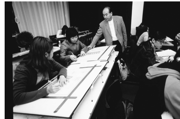
專班開設美術講座深根藝術

若針對相關課程有任何疑問者可洽聯絡電話02-28610511#11204，郵寄地址為台北市士林區華岡路55號教務處綜合業務組。