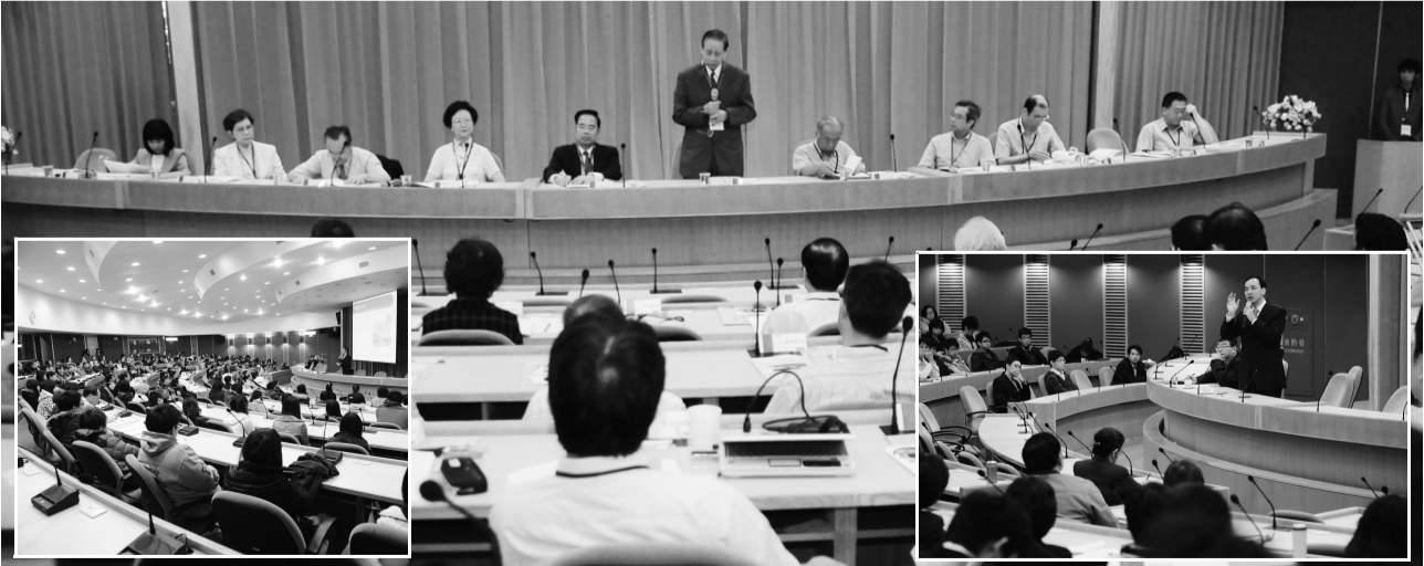
演講分享經驗提供學生不一樣的視角