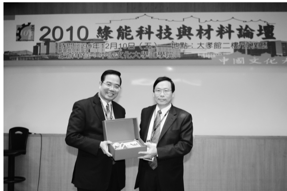
綠能科技主流邀請專家蒞校演講

今年暑期專班有分為專案課程及模組課程兩種，專案課程內容為危機管理與組織行為，分別為1學分18小時。模組課程則自7月27至