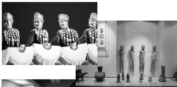
培養藝文欣賞之能力

為提升全校性藝術美學教學品質，開發學生藝術鑑賞能力，未來在本計畫之支持下，100-101年度將開設「藝術護照」相關課程6門，建置「藝術展演平台」網站，規畫教材、展演、講座等影音資料數位化。建佈全校數位多媒體影音傳播平台，增設學生藝文表演空間。建立多媒體藝術製作中心，建置數位典藏、數位攝影社群，提供教學與實習之用，並製作不同類型之節目，提升師生人文藝術素養，並培育數位傳播人才，預計100-101年將有800名學生參與並取得「藝術護照」。