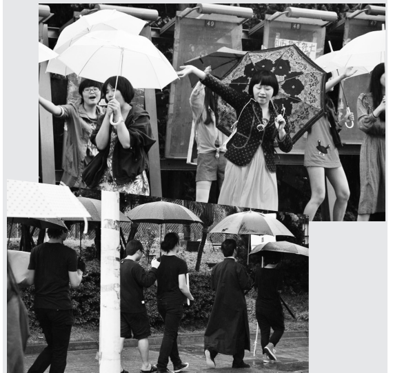
雨中熱情舞蹈引發注目，後方的喪禮團隊卻處變不驚！這是大傳系的同學突發奇想，用舞蹈來呈現多元文化，用喪禮來宣告書店已死

表演，讓馬來西亞的學校了解文化大學的特色與優點，歡迎喜歡舞台表演的學生報名參與。 參與馬來西亞演出表演的藝術學院總計已有 18 位學生，同時，還將遴選 2 到 3 位，歡迎對中國文化傳統藝術表演類學生報名參加，如魔術表演、傳統口技、人體藝術類等，機票食宿全免，同時能在馬來西亞登台演出，有助提升個人表演資歷。 今年甄選時間為 2011 年 05 月 25 日早上 13 時 00 在興中堂，甄選方式採自選項目或才藝表演約 3 分鐘，內容以發揚本校特色及校園生活為主。