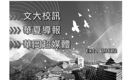
圖書館者目前也正徵求擔任整理書籍工讀、總務處各處也徵求華岡園丁，當個服務熱忱校園尖兵，你一定可以。對視聽影音有

要更認識華岡之美的學生，都可以申請工讀，有意者請儘快至資訊中心 802 登記申請。或直接填寫 editor@staff.pccu.edu.tw。