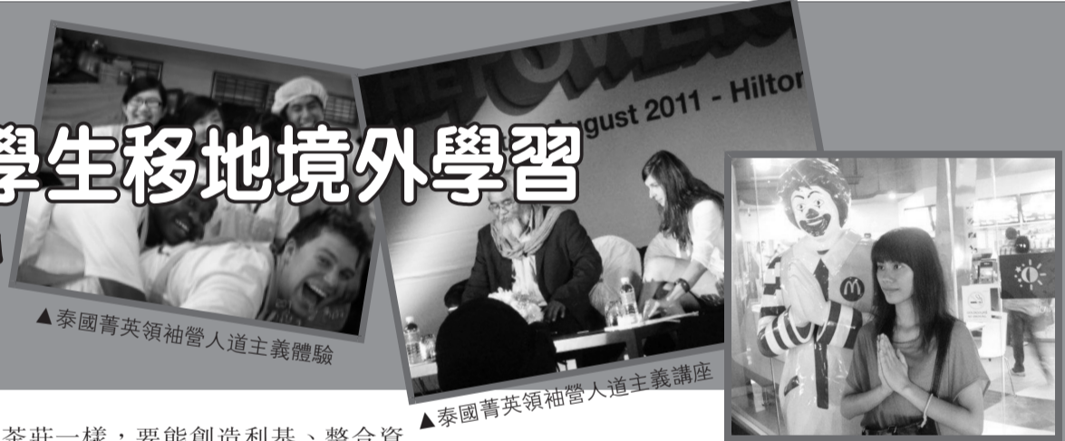
▲泰國菁英領袖營人道主義體驗