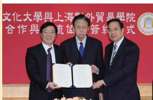
本校於2011年與上海對外貿易學院簽約