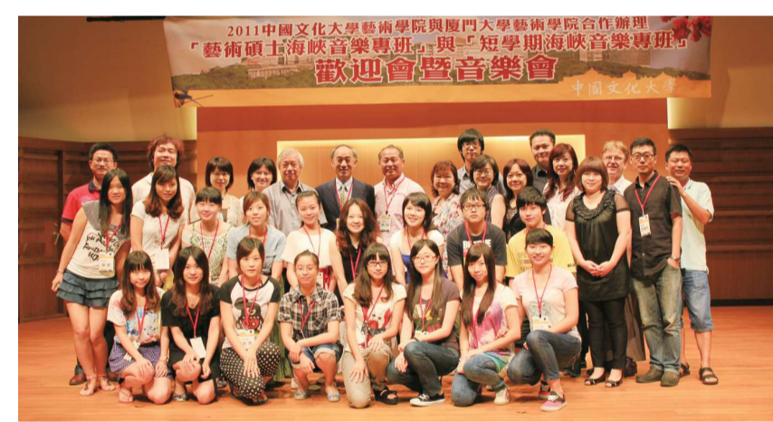
大陸廈門大學師生來台學習