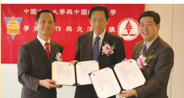
中國文化大學與中國政法大學簽訂姊妹校