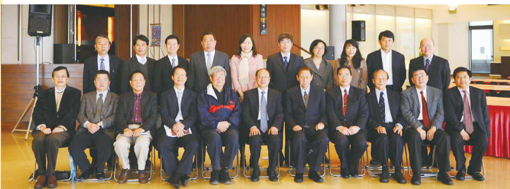
大陸國台辦鄭立中主任率大陸國台辦幹部與文大教授合影