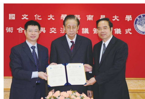
本校於2010年與南昌大學簽約