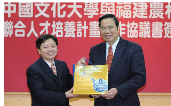
本校於2011年與福建農林大學簽訂人才培育協定