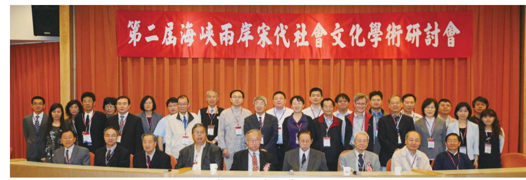
文學院舉辦兩岸研討會獲迴響

傑出事蹟 教學及行政經歷豐富，曾任北體學務處課外活動組助教、組長、總務長、學務長、教務長、副校長、校長，也曾帶領北體通過教育部校務評鑑，亦擔任體育類評鑑委員 專精排球運動教練，帶領球隊屢獲佳績，目前亦擔任中華民國排球協會副秘書長及台北體院女子排球隊執行教練