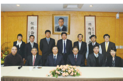
本校接待南開大學教授