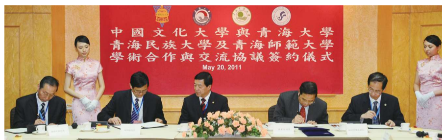
本校與青海大學、青海民族大學、青海師範大學簽約