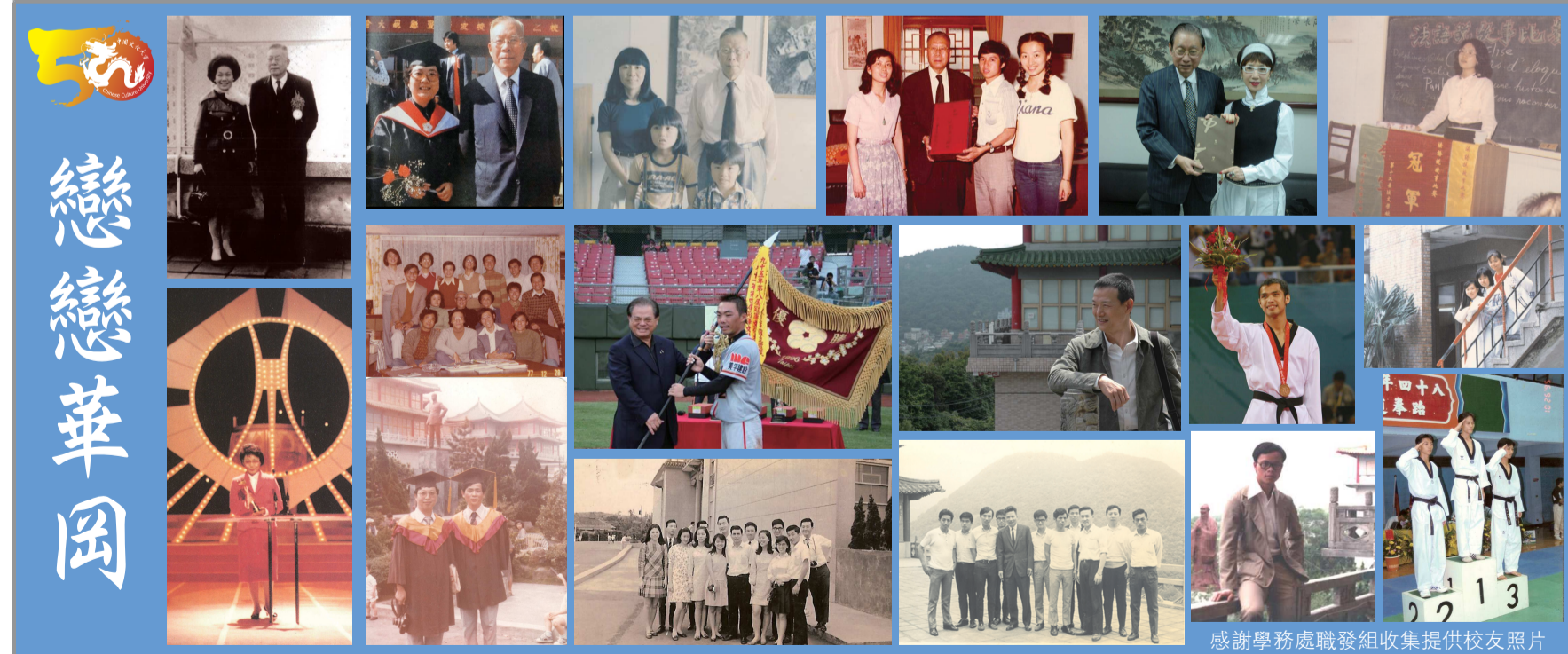
感謝學務處職發組收集提供校友照片

準備充分的人，才有最佳的機會；不要忘了自己成長的同時，他人也不斷在進步，因此我們更要邁開步伐，不僅要步步為營，也要步步開花。期待十年後，甚至更快，我們就可以實現本校「深耕文化，提升學術地位，創校60週年邁入世界知名大學」之願景，締造華岡人的驕傲。