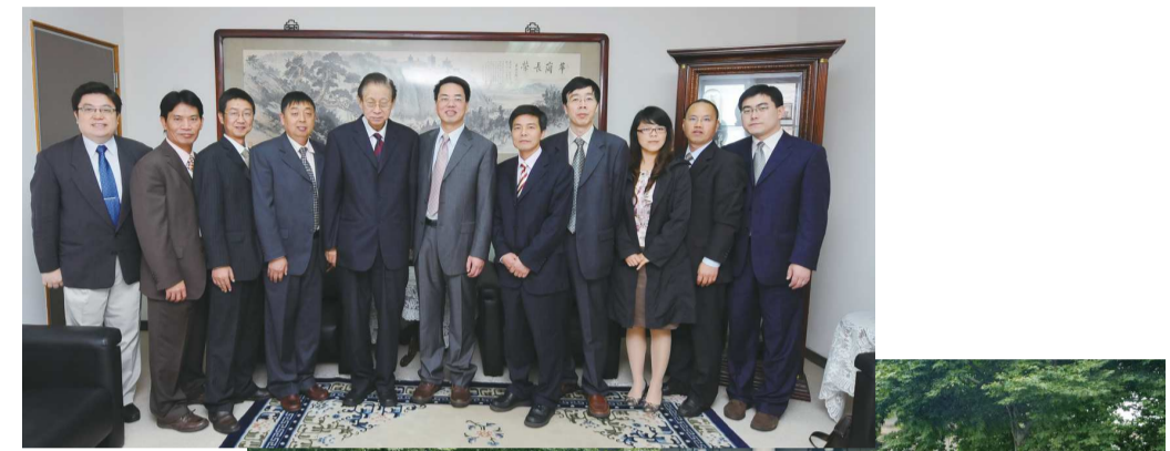
張董事長接待寧波大學教授