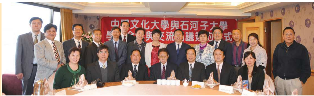
本校於2011年與石河子大學簽訂學術合作與交流協議

中國文化大學創辦人及教授在中國大陸出版書籍目錄四份。 中國文化大學寒假班中國大陸二百五十位學生參加，開學典禮致辭稿四份。 中國大陸學生講習班講義稿「中國的經濟發展」四份。 中國大陸學生講習班講義稿「地球增溫及其影響」四份。 書籍三本： (一) 張其昀《孔學今義》繁體字版。簡體字版由北京大學出版，英文版由浙江大學出版。 (二) 張鏡湖《世界的資源與環境》，簡體字版由中國科學社出版。 (三) 池田大作與張鏡湖對話錄《教育與文化的王道》，日本創價學會出版社。