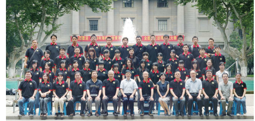
本校學生前往大陸東南大學參加建築營