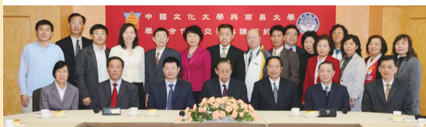
本校於2010年與南昌大學簽約後合影