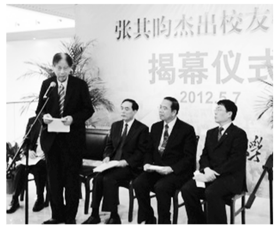
張董事長率師長與校友前往剪綵