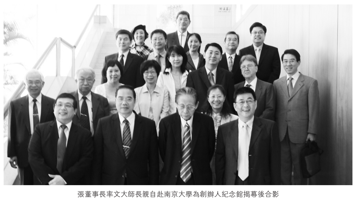
張董事長率文大師長親自赴南京大學為創辦人紀念館揭幕後合影

張創辦雖曾擔任黨政要職，但終身職志是致力於中國文化的宣揚。1962 年他以「承中西之道統，集中外之精華」的理念，創立中國文化大學，編纂《中文大辭典》，邀請多位國學大師擔任編輯，數十位學者參與，歷時 8 年，完成最完備的中文大辭典，此書付梓後即成世界漢學機構必備之典籍。