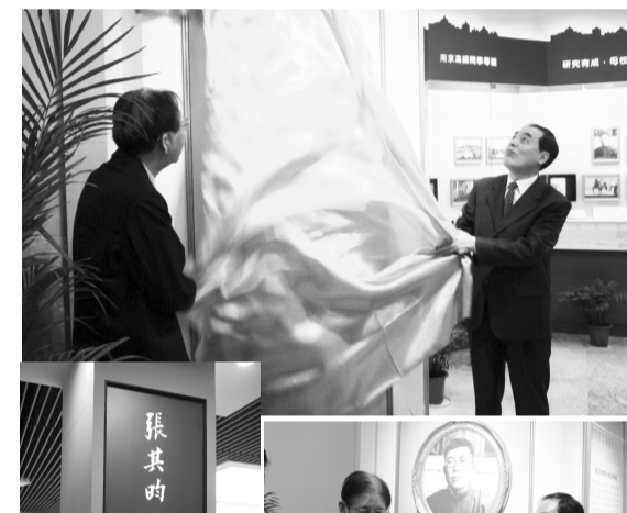
張董事長於開幕式時致詞