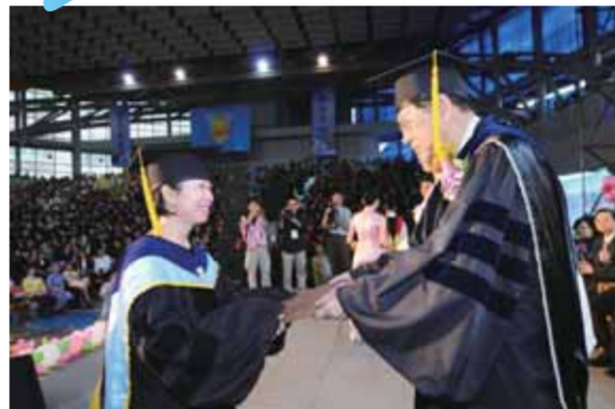
張董事長為博士班學生頒發畢業證書