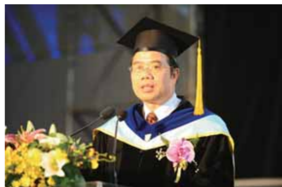
吳校長致詞鼓勵畢業生謹遵創辦人遺訓堅持質樸堅毅精神，勇敢迎未來挑戰