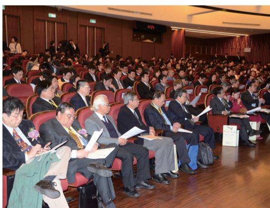
池田大作國際論壇齊聚來自全球各地的學者蒞臨