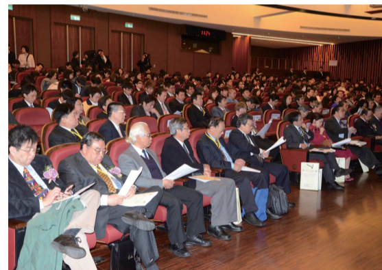
池田大作國際論壇齊聚來自全球各地的學者蒞臨