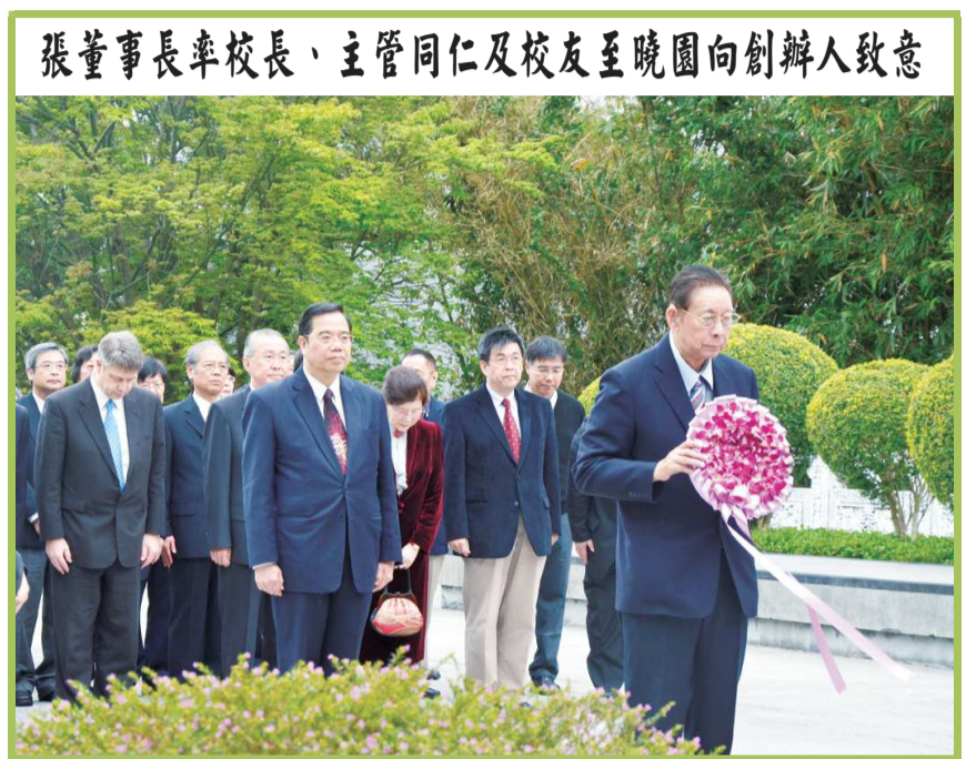
張董事長率領校務會議成員及校友代表向創辦人張道藩先生銅像致敬。

吳萬益校長說，今年校慶主題為「活力華岡，文化飛揚」，因為，不論大家在華岡的日子有多久，每一位華岡人對佇立陽明山頭，鳳鳴高岡的文大歲月，仍然記憶猶新；那春天風和日麗，遠眺觀音山河；嚮往夏夜輕狂，呼朋喚友台北夜景；憶起秋天雲霧飄渺，氣象萬千；而冬天頂著刺骨寒風，一步一步進行求學的刻苦經驗，這些點點滴滴，都是華岡人難以忘懷的美。