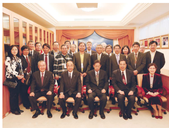
文大池田大作研究中心成立十年 董事長與貴賓合影