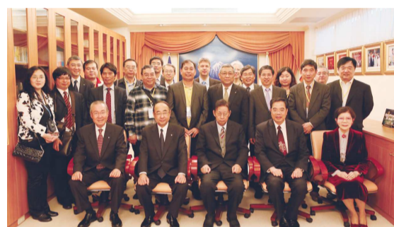
文大池田大作研究中心成立十年 董事長與貴賓合影