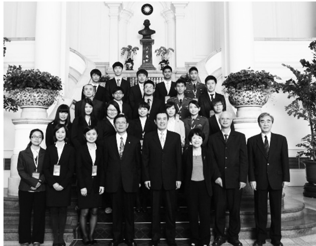
馬英九總統接見102年青年獎章得獎人、社會及大專優秀青年代表

【文 / 李文瑜】馬英九總統於今年三二九青年節在總統府接見「全國大專優秀青年代表」，該獎項計有一百四十七名大專生入選，文化大學則由行管系藍晏彬同學獲選全國大專優秀青年代表接受公開表揚，藍晏彬同學曾擔任原住民新傳社社長、華岡合唱團團高音、洄瀾舞集團員，積極參與校內外各項原住民事務推廣及藝術文化有顯著的表現，獲得大專優秀青年代表，足堪學校學生模範。