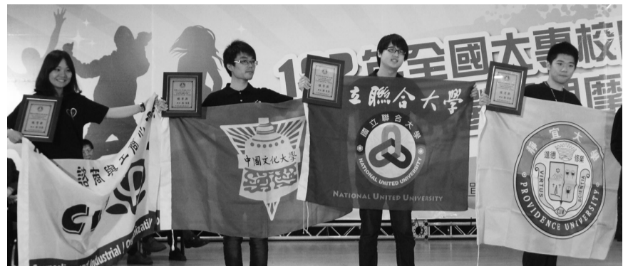
本校學生會「地理系學會」獲得「優等獎」、「華岡康輔社」獲得「績優獎」

【文/洪孜佩】教育部為促進大專校院學生社團活動進步與發展，於102年3月30、31日在中興大學辦理「102年全國大專校院學生社團評選暨觀摩活動」，本校推派系學會的「地理系系學會」，以及「華岡康輔社」，代表本校前往參賽，由於該活動競爭激烈，共計有154所公私立大專校院參加，283個學生社團參與評鑑，本校的兩個學生團體歷經兩個月的檔案製作模擬演練