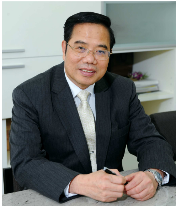
恭賀 5,516 位畢業生 展翼飛揚

每年這個時刻是驪歌唱起的季節，在此我們以歡喜與祝福的心情舉辦101學年度學生畢業典禮，首先非常恭喜應屆畢業同學，本屆計有博士生40人，碩士生534人，大學部4,437人，推廣教育部505人，共5,516人順利完成學業，取得畢業資格，恭喜各位畢業同學！正冠及頒贈畢業證書是非常莊嚴而有意義的儀式，代表這個階段學成，具備相當的學識與能力，就要配著寶劍下山了。大學之道在明明德，在親民，在止於至善，完成大學教育，後能任重道遠，這是學習承擔的開始。從今天起，各位即將步出校門，展開新的旅程，有的要繼續深造，有的即將進入職場，成為社會的新鮮人，希望大家都能發揮所學，貢獻社會。在這裡，我要向各位家長致敬，我相信每位畢業生從出生到進入小學、中學及大學的學習過程中，家長們都付出最大的心力，各位家長栽培子女有成，今天同學們能夠順利畢業，就是給家長們最大的禮物，同學們最應該感謝的也是各位家長。接著我們要感謝學校的師長及同仁，由於各位愛心與耐心地付出，使同學們在文大的學習過程中，逐漸由青澀稚嫩轉為成熟自信，由率性依賴邁向沈著獨立，這段成長經歷幸賴各位師長同仁給予扶持。另外，我要再特別感謝各位貴賓蒞臨，由於您的參與與祝福，使今天的畢業典禮顯得更加溫馨隆重，也讓即將畢業的同學們感到無比的榮耀。