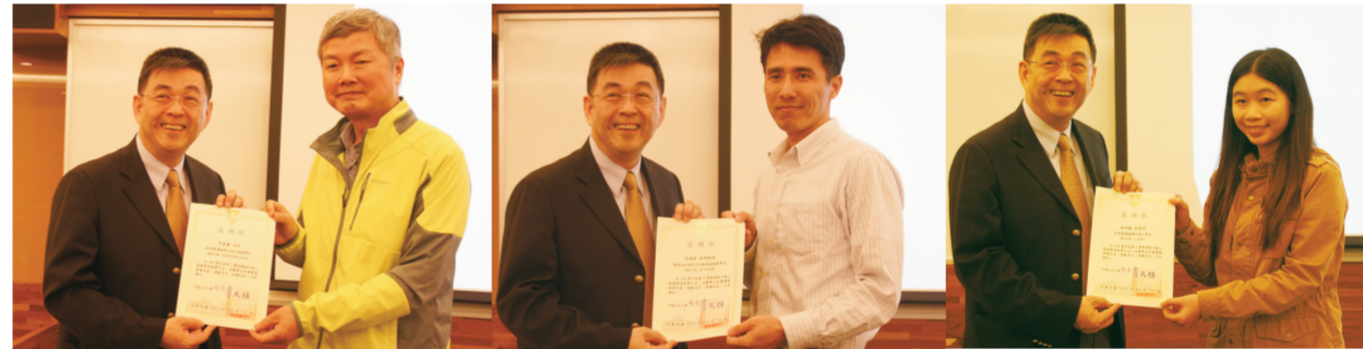
李校長表揚在服務學習推動上表現優良的師生

於本校網站首頁建置中國文化大學服務學習網，以 e-page 製作網頁，由本校資訊中心協助系統維護，網站內容包括：服務學習辦法、服務學習理念、校園公共服務學習、學生課外服務學習及專業課程服務學習等各項辦法、表單、報名系統、資訊公告、活動公告、活動成果、回饋問卷等功能，將學生所須之服務學習資訊放置網路中，提供學生遠端查閱、報名或填寫回饋問卷。