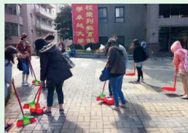
2.風超大的大恩前廣場