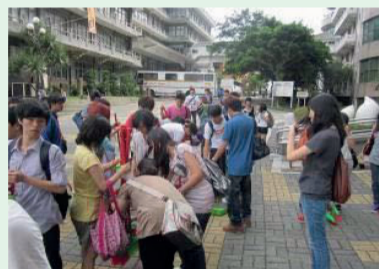
1.準備領取掃除工具的同學們