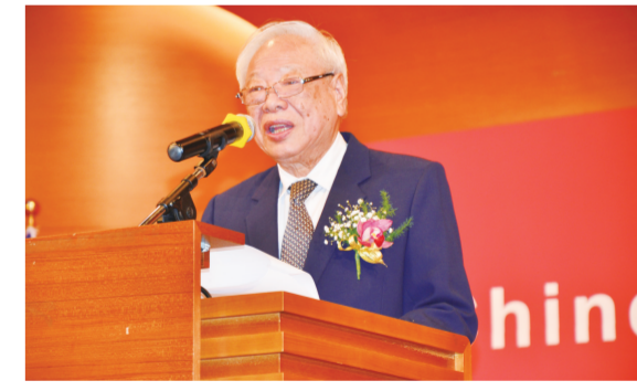
前司法院院長翁岳生推薦