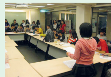
2.機構秘書針對工作項目進行確認