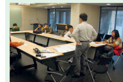
1.實務律師解說及指導