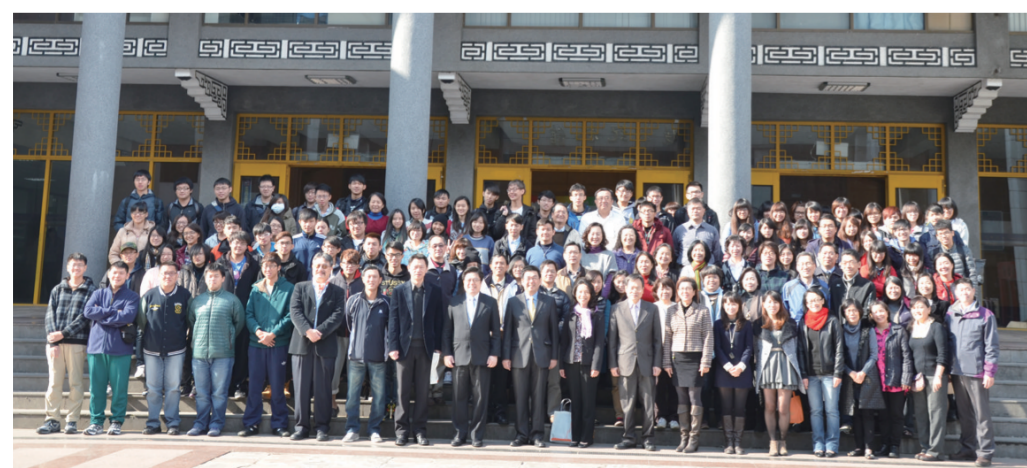
《文大校訊》為您掌握校園動態。歡迎前往曉峰紀念館資訊中心八樓、圖書館櫃檯或大雅館、大慈館櫃檯索取。

李校長希望透過德育的推動有助於品格的養成，以學校傾心之力，提倡身體力行，期望大學全人教育均衡發展相互為用，使學生構成一個完整統一的整體。