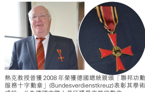
熱克教授獲頒2008年榮獲德國總統親頒「聯邦功勳服務十字勳章」(Bundesverdienstkreuz)表彰其學術成就，此為德國文職人員所獲最高等級勳章。

德國在台協會紀禮處長指出，很高興看到熱克教授獲頒中國文化大學名譽法學博士學位，希望藉此表彰熱克教授在法學之傑出表現外，更能開展台德學術交流之路。