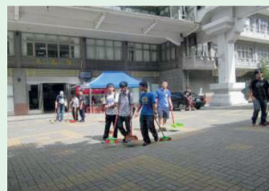
3.大義大典的服務同學們