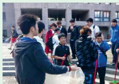
4.熱心的同學提著垃圾袋尋找需要幫助的同學