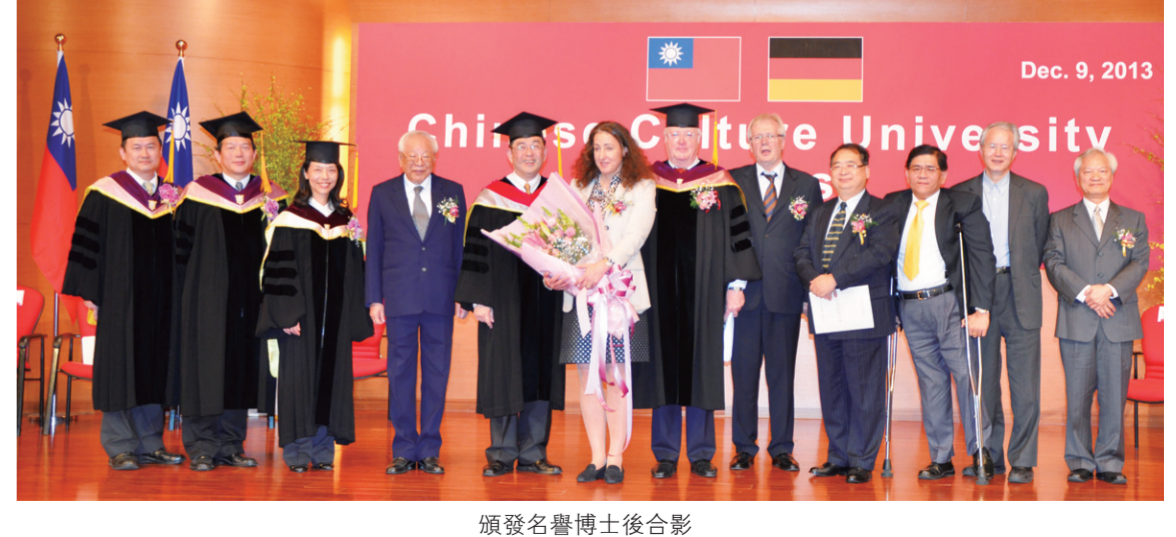
頒發名譽博士後合影