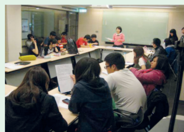
3.同學研讀培訓手冊