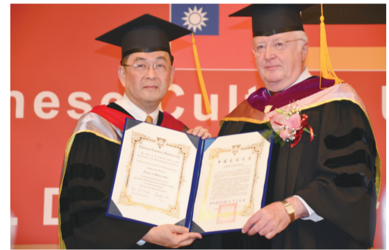
李校長頒發榮譽博士證書