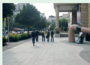
6.準備回學校進行資料整理和反思討論