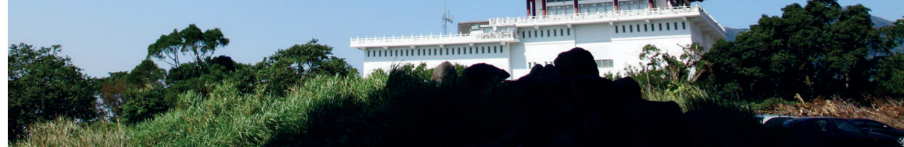
《文大校訊》為您掌握校園動態。歡迎前往曉峰紀念館資訊中心八樓、圖書館櫃檯或大雅館、大慈館櫃檯索取。

看在我眼中的華岡形象，亦如那一盞燈，那一幢巨影，與燈相對的，是日夜薰習其中的我，是守著夜色的華岡人，是否也正秉持華岡心傳，護衛著博大精深的大中華文化。