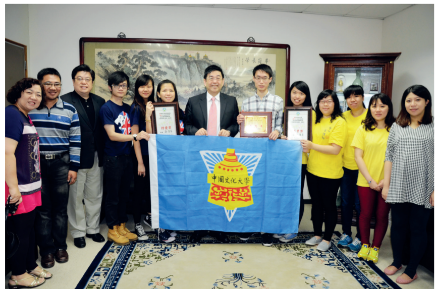
校長與獲獎社團同學合影

獲得本次卓越獎之自治組織幹部，教育部青年發展署得邀請於後續「自治組織發展與傳承研習營」擔任輔導員。此外，本次競賽評分標準中「校務參與及學生權益」和「財物制度」比例均佔15%以上，顯見本校學生會在這兩方面均表現優異。