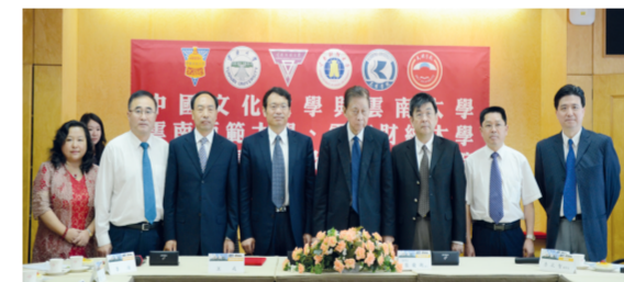
本校與雲南財經大學簽訂學術合作與交流協議