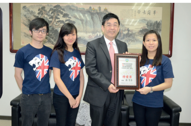
英文系獲特優與校長合影