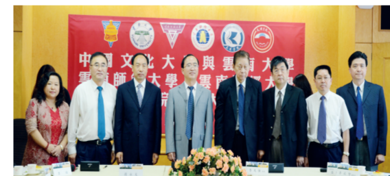
本校與昆明學院簽訂學術合作與交流協議