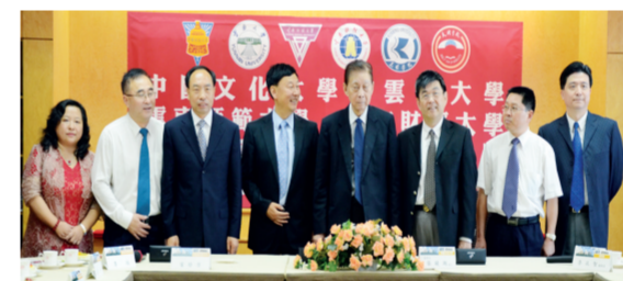
本校與雲南師範大學簽訂學術合作與交流協議