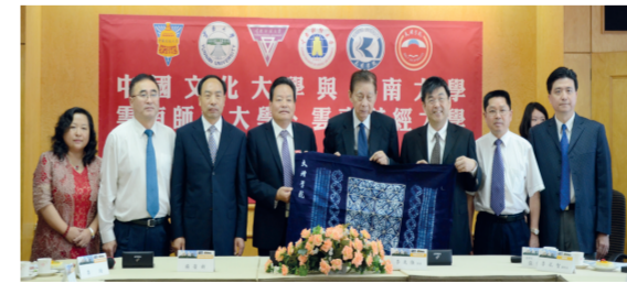
本校與大理學院簽訂學術合作與交流協議