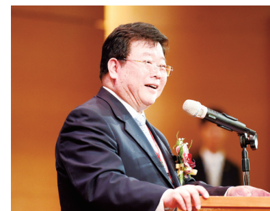
孫亞夫副會長：這是一場水平極高影響極大的兩岸學術交流平台