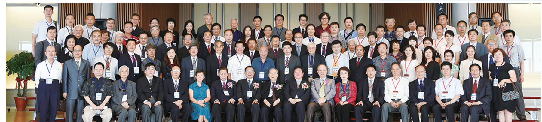
第十九屆中國現代化學術研討會在體育館舉行會後，貴賓合影。

第四個題目是“中華文化與企業倫理”，中國文化以儒家為主，但也包含了道家與佛教的思想，道並行而不悖，因此沒有西方國家自古以來不斷的宗教戰爭。最近烏克蘭和中東的戰爭即為例證。中國在世界各地設有七百多個“孔子學院”和“孔子教室”。中國文化大學的創辦人張其昀先生所著“孔學今義”一書，於2009年由北京大學出簡體字版，浙江大學去年出版英文版，儒家思想的包容性是中國自秦漢以後大一統的重要原因。我希望每一年的會議能有豐碩的成果。