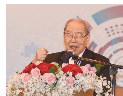
梅可望董事長：國家要穩定發展就要邁向現代化