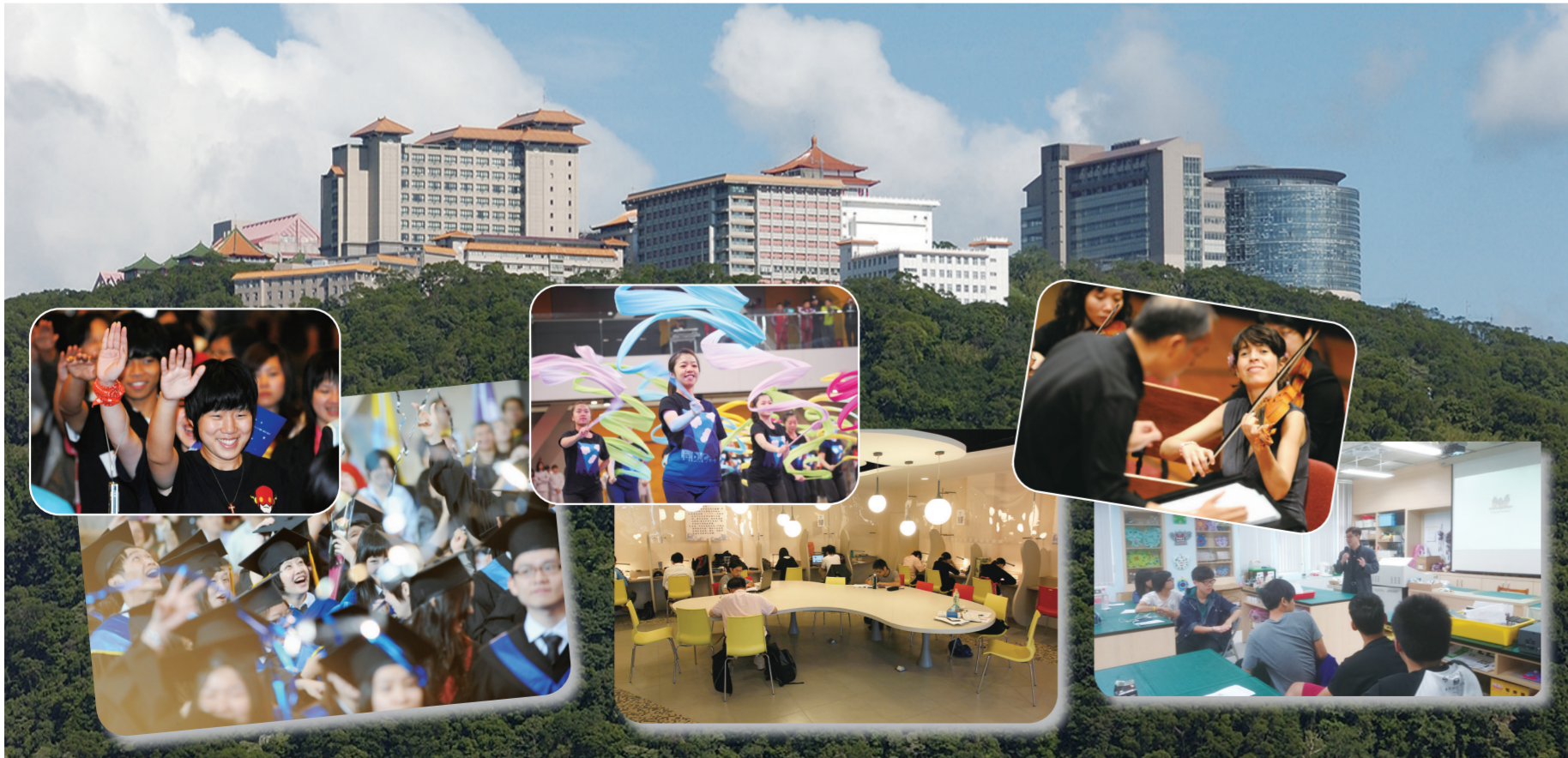
《文大校訊》為您掌握校園動態。歡迎前往曉峰紀念館資訊中心八樓、圖書館櫃檯或大雅館、大慈館櫃檯索取。