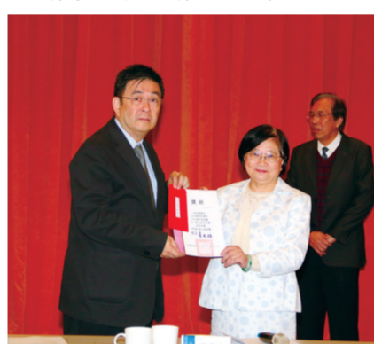
生活應用科學系註冊率 96.49%