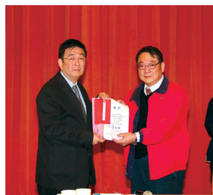
勞工關係學系勞資關係組註冊率 96.61%