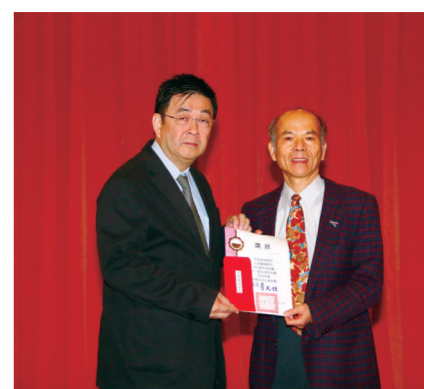
心理輔導學系註冊率 98.31%