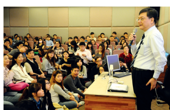
杜紫軍部長主講區域經濟整合與貨貿協議

杜紫軍部長分析，兩岸經貿關係未有進展時，會影響台灣與其他國家洽簽FTA，或加入多邊協定時「不會有助益，也可能會有阻力」。由於兩岸存在非常微妙的關係，因此若能順利完成ECFA後續協議，絕對有助於台灣與其他國家洽簽FTA。