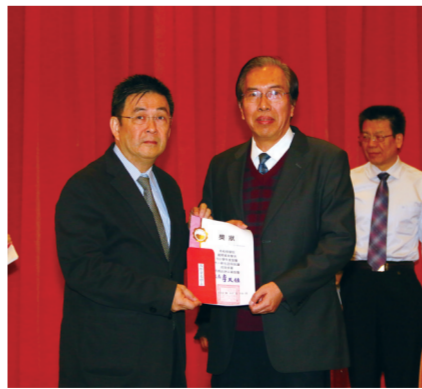
國際貿易學系註冊率 95.24%