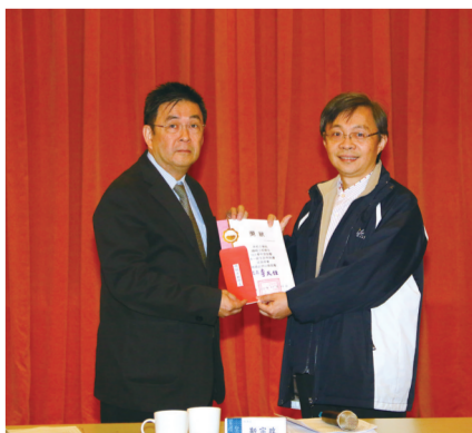
機械工程學系註冊率 95.50%

《文大校訊》是一份報導教育政策、記載華岡大事，與全校師生加強溝通的刊物，歡迎全校師生提供訊息，進行交流。