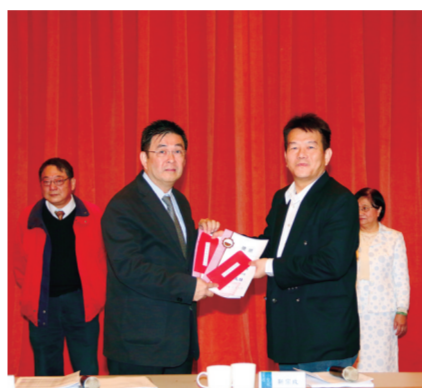
法律學系財經法律組註冊率 96.61%