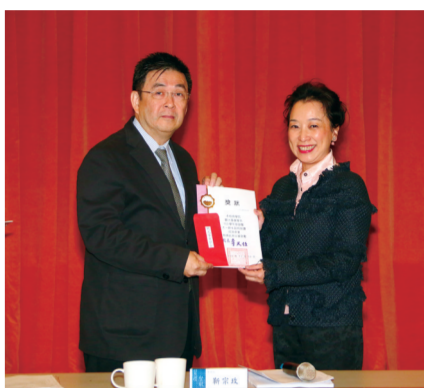
觀光事業學系註冊率 96.43%