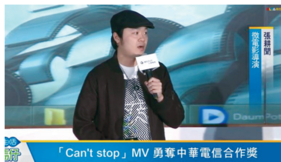
「Can't stop」MV 勇奪中華電信合作獎