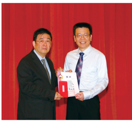
資訊管理學系註冊率 95.83%