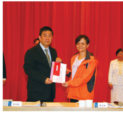
英國語文學系註冊率 95.54%