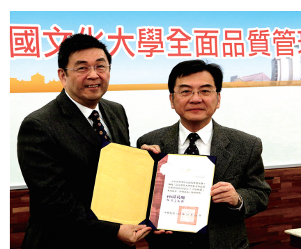
李校長頒贈感謝狀予元智大學陳啟光教授

會計室 自強圈 以改善住宿保證金退費作業流程 奪冠 人事室 轉圈圈 以增加行政同仁輪調制度 媒合率提升工作效率 亞軍