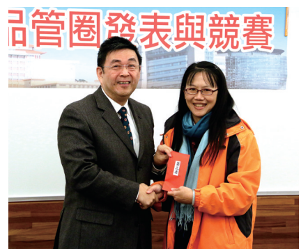
資訊中心「迴力圈」季軍

【文／李文瑜】以「知識管理領航，價值創新推手」為題，本校在張鏡湖董事長領導之下，2014年6月全面積極推動TQM，落實管理體系，以提升教學、研究、行政及服務品質，確保文大邁向「學術卓越、品質保證」的標竿目標。在推動全面品質管理，運用品管圈手法協助內部教職員工進行各項改善活動，外聘中國生產力中心針對本校13個品管圈進行輔導，各行政單位提出品管圈改善主題及成員，透過品管圈運作，提高行政效率，並辦理品管圈競賽及成果發表。第1名，獎金10,000，由會計室組成的「自強圈」獲得，第2名，獎金8,000，由人事室組成的「轉圈圈」獲得，第3名，獎金5,000，則由資訊中心組成的「迴力圈」獲得。 此次共13個品管圈進行發表，95人到場參與，會中並安排元智大學陳啟光教授進行「品管圈在大學推動全面品質管理的角色與定位」專題演講，陳啟光教授提