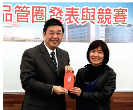
人事室「轉圈圈」亞軍