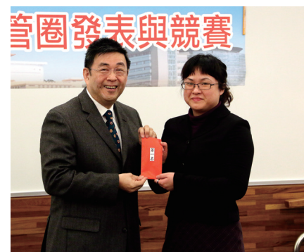
會計室「自強圈」奪冠