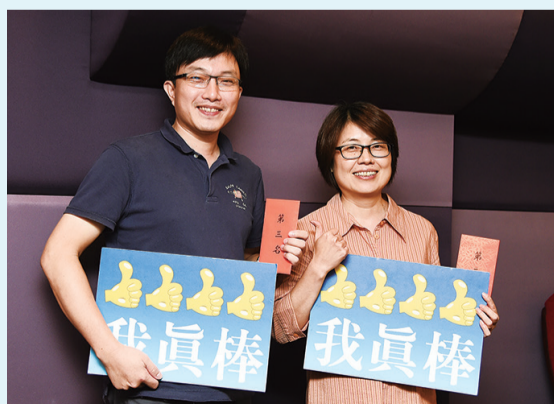
推廣部今年首次參與品管圈，圖為千里 e 線圈及大家畫圈圈，拿下好成績

中國文化大學在張鏡湖董事長領導之下，今年全面積極推動 TQM，落實管理體系，以提升教學、研究、行政及服務品質，確保文大邁向「學術卓越、品質保證」的標竿目標。在