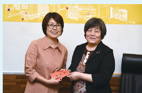
千里 e 線圈