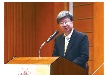
教育部吳思華部長致詞