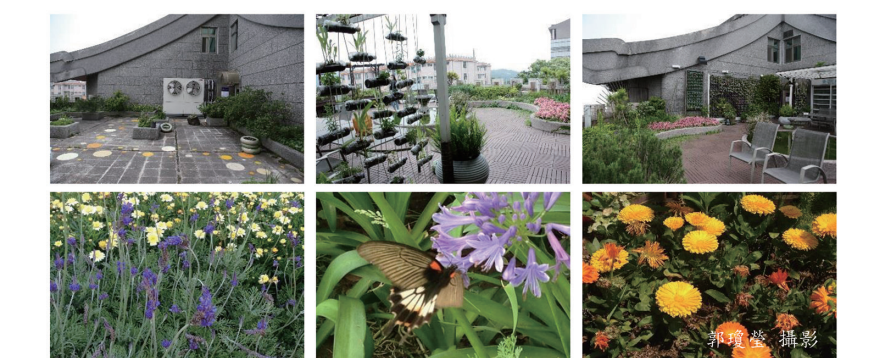
大典天台花園經景觀學系同學認養、清理、維護，提供大家共享愉悅空間

為了實踐「自己的環境自己管理」，也嘗試運用「社會設計」空間經營手法，已請景觀學系同學分組認養天台花園植栽之養護，我們經營了「可食地景」，種植了無毒的蔬菜與香草植物。但每每星期一來學校就是一堆垃圾，同學們抗議說：「我們已很辛苦的清理了，但為何我們永遠改變不了破壞環境同學的習性，我們不想再清理了.....」。