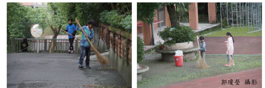
小學生都有校園勞動時間

近期幫教育部的「美感教育」全台巡迴演講，也參與其「校園美感教育」補助計畫之評審。多數委員的共同感想是—從小學到大學，校園環境美質與學生品格似乎隨年齡愈大問題愈嚴重！自悲哀的角度觀之，小學生尚聽從老師之生活美質引導，而當其漸漸長大漸漸獨立思考後，「美育」、「倫理」、「規矩」漸受社會影響，愈獨立自主，卻愈向社會之失序方向傾斜。中小學都有勞動課，常見他們動手拿掃帚清理校園、教室，先不談美學，但至少是乾淨的、整潔的。