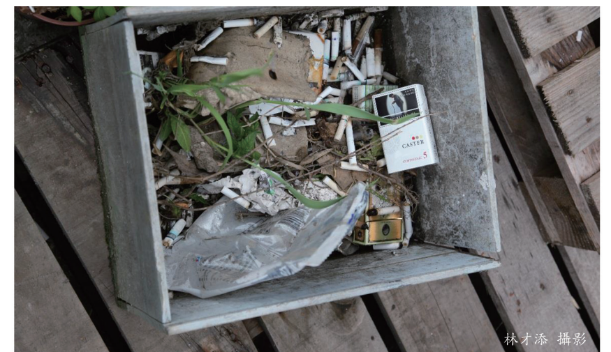
同學義務放置木箱，總算可收集一下煙蒂垃圾