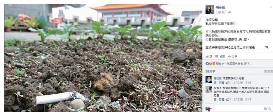
抽煙沒錯，亂丟煙蒂就是不對!!!

「禁煙」是政策，但若無法落實，只是貼告示，無法影響同學對自我健康的觀照，其實是徒勞無功的。此外，又礙於法令，非吸煙區不得設置煙蒂垃圾桶，當吸煙者已不顧自身健康時，其吸煙又亂丟垃圾之行為早已影響公共權益了。而身為大學，有這麼多專家學者卻對此議題仍無解，不僅汗顏，更痛感到底教育的目的何在？「品格」教育只是宣傳上的文字嗎？「美感」教育也只是個人外表之時尚，卻與其言行脫節衝突？