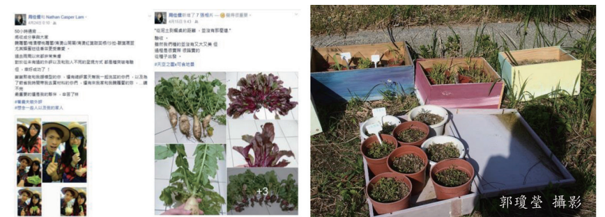
景觀學系同學運用「社會設計」空間手法經營「可食地景」

為了實踐「自己的環境自己管理」，也嘗試運用「社會設計」空間經營手法，已請景觀學系同學分組認養天台花園植栽之養護，我們經營了「可食地景」，種植了無毒的蔬菜與香草植物。但每每星期一來學校就是一堆垃圾，同學們抗議說：「我們已很辛苦的清理了，但為何我們永遠改變不了破壞環境同學的習性，我們不想再清理了.....」。