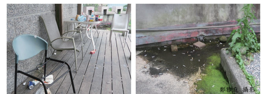
大典天台花園的亂象

只是身為環境設計學院的一份子，我們師生共同設計經營的天台花園，儘管有同學認養、清理，但總有一個天台永遠充斥煙蒂、垃圾、吃完喝完的杯子、食盒，還有 PE 袋...，每每提出這些「生活基本禮儀」無法落實之問題，卻總無解。