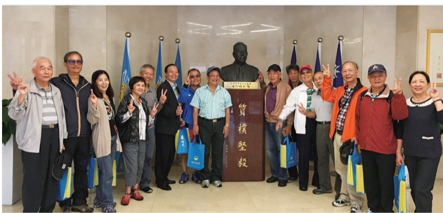
市政系第二屆校友 11 月 8 日重返母校拜訪師長