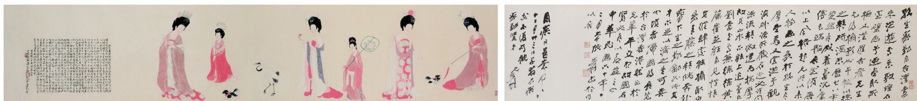
孫家勤 仿周昉簪花仕女圖卷