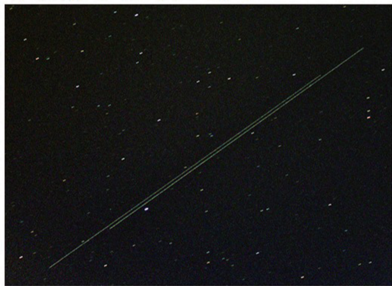
"This picture shows the taikonauts leaving the Tiangong-2 onboard their Shenzhou-11 spacecraft," says Tan. "They had just separated at the time I took this 20 second exposure."

TAIKONAUTS RETURN TO EARTH: Chinese astronauts (taikonauts) Jing Haipeng and Chen Dong are back on Earth. They've just finished a month-long mission to China's new space station, the Tiangong-2, doubling their countries' record for time in space. Observing from Taipei, Taiwan, amateur astronomer Hanjie Tan photographed their departure on Nov. 17th: