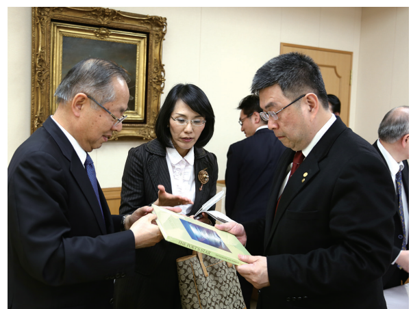
創價學會吉鄉主事贈送池田大作先生攝影集給李校長。