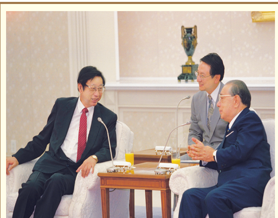
中國文化大學張鏡湖董事長 國際創價學會池田大作名譽會長