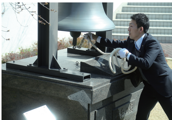
關西創價學園敲響校內自由鐘，歡迎李校長蒞臨參訪。