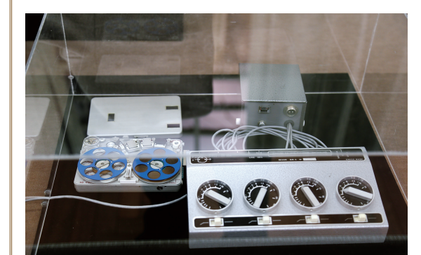
東京牧口紀念館，目前保存有創價學會名譽會長池田大作與本校張鏡湖董事長等世界名人對談紀錄等相關文物，圖為池田先生與湯恩比博士對談時的錄音機及音檔，讓參訪者可以近身聆聽池田先生的關鍵談話。