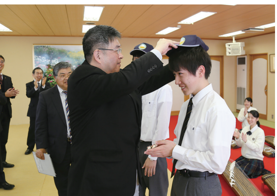
李校長贈送關西創價學園古箏演奏學生文大 logo 帽。