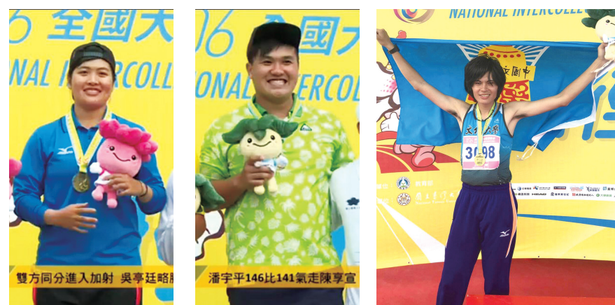
中國文化大學榮獲全大運射箭複合弓對抗賽男、女子組冠軍！

囊括全國大學運動會每一項目的奪牌數，在參賽與獲牌選手種類排名上，本校仍為全國私立大學之冠。