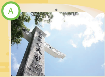
A 屹立華岡山仔后 華表昂首迎嘉賓

屹立在格致路、愛富二街口的「華表」，俗稱鳥牌，既是文大校門，也是前往文大第一個看到的文大指標。