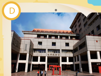
D 曉峰紀念館三區 文化美學涵養聖地

中國文化大學校門口外美食街，美食小吃是一絕，店家林立：感恩、鐵板便當、大學城、台北城、有省錢、牛肉拌麵、好口味...都是台灣美食雜誌刊登過的知名店家。