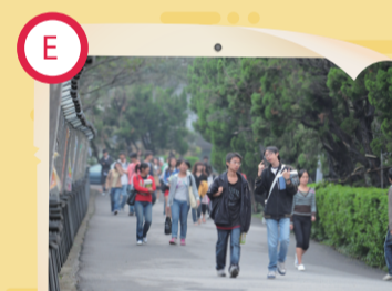
E 荀子大道步步高 仇人坡前泯恩仇

文大荀子大道是一條長坡，更是上下學必經之路，但一般稱為「仇人坡」。一說是因係必經之道，故遇仇人也難迴避；一說是一大早就要爬坡好累，故戲稱為「仇人坡」。