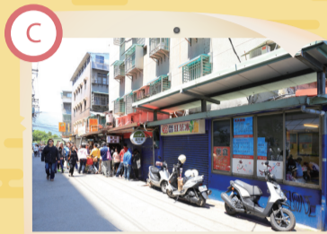
C 光華路與華岡路 美食小吃成一絕

鄰近文大的美軍宿舍群，已逐步變身文創美食新聚落，提供陽明山遊客用餐與休閒多元選擇，更是老師與學生齊聚的好場地。