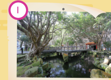
I 川流不息百花池 國寶藍鵲棲息地

站在大義館天台環視，文大校園風光盡收眼底；夜晚登樓，滿天星斗、徜徉銀河，更是文大四年生活絕不容錯過的美景。