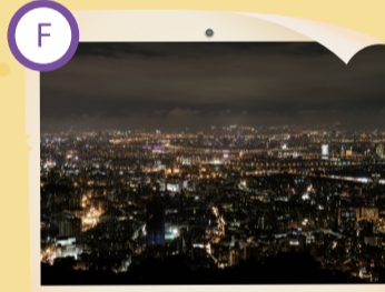
F 東山路情人坡 無敵夜景十景之首

文大荀子大道是一條長坡，更是上下學必經之路，但一般稱為「仇人坡」。一說是因係必經之道，故遇仇人也難迴避；一說是一大早就要爬坡好累，故戲稱為「仇人坡」。