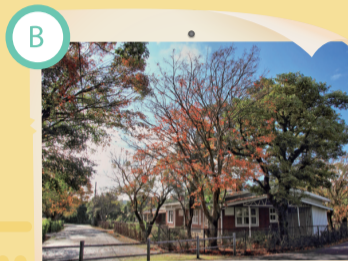
B 美軍宿舍聚落 變身美食新天堂

屹立在格致路、愛富二街口的「華表」，俗稱鳥牌，既是文大校門，也是前往文大第一個看到的文大指標。