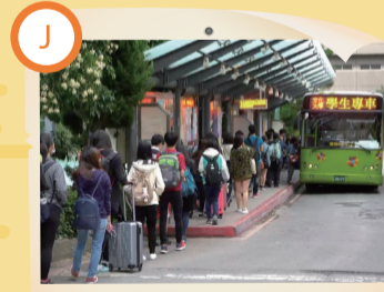
J 文大時尚公車亭 圈圈排隊成奇景

百花池廣場是文大辦活動盛地，從學期初到學期末充滿文大學生的熱情與活潑；池畔大樹繁盛，是台灣國寶鳥藍鵲棲息地。