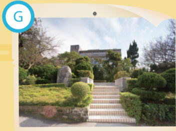
G 曉園紀念創辦人 變幻萬千夕照之美

低頭俯瞰，堪稱全台北無敵的大台北夜景盡收眼底；抬頭仰望，明月當空、星光璀璨，這風華絕代的夜景，可是文化人最驕傲的十大景之首。