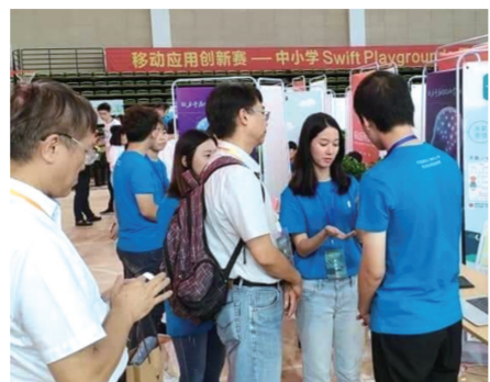
Apple 大中華區董事總經理葛越與逢甲李校長聽本組簡報

2017 年為了鼓勵更多學生加入程式設計行列，亞洲最大 Apple 經銷商 STUDIO A 旗下校園店 Straight A，與全台唯一逢甲大學「Apple 區域教育培訓中心」(Apple Regional Training Cen-