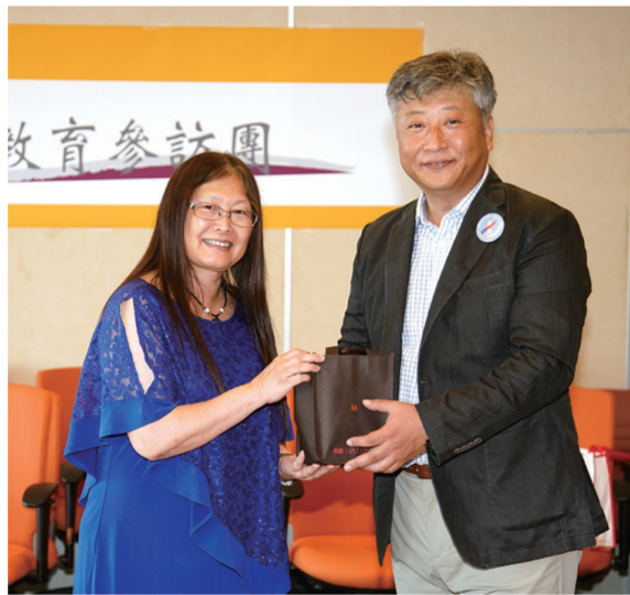
未來能再到韓國交流，也有更多韓國學生選擇來文大就讀。

王校長說，文大很早就進行國際化，國際化也很先進，如今每年從韓國來的交換學生居四位，去年赴韓的文大學生也將近百位，很高興能藉由此次的交流，建立更深厚的友誼，希望