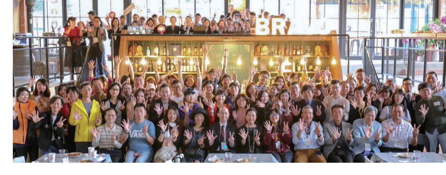
《文大校訊》是一份記載華岡大事，與全校師生加強溝通的刊物，歡迎全校師生提供訊息，進行交流。