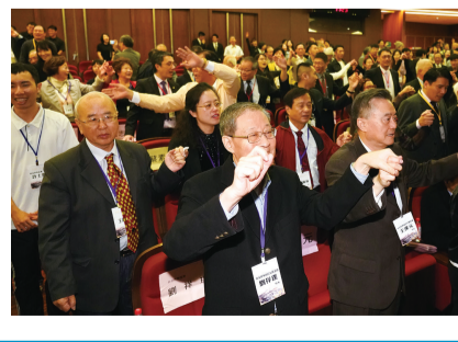
《文大校訊》為您掌握校園動態。歡迎前往曉峰紀念館資訊中心八樓、圖書館櫃檯或大雅館、大慈館櫃檯索取。