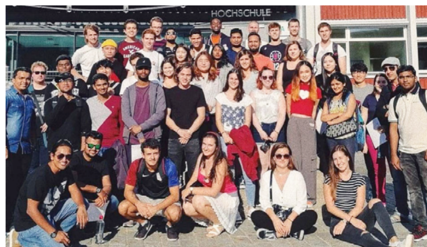
【文 / 楊湘鈞】109 年度教育部學海計畫補助獎助學金 563 萬元，在海計畫獎助結果出爐，文大共獲教