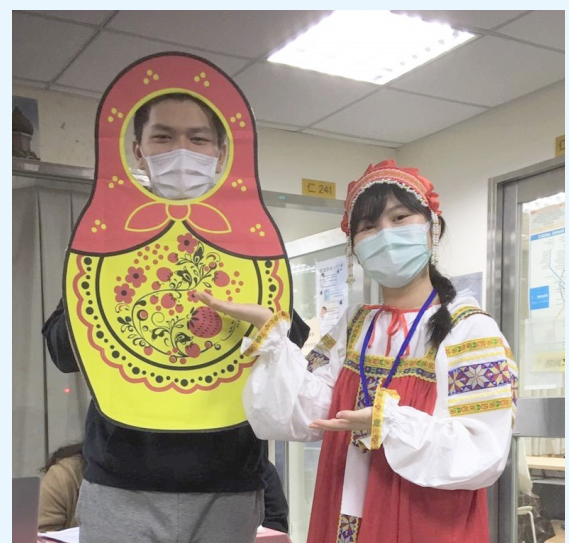
▲文大俄文系 109 註冊率大躍升，反應學子對語文專長已有「物以稀為貴」的市場區隔概念

由於文大規模多達 13 個學院 62 學系，屬多領域的完整綜合大學，而註冊率又是考生最終、最真心的就讀抉擇，從文大今年各院系新生註冊率的數字，也可一窺年輕人對大學學涯與未來職涯的想像。