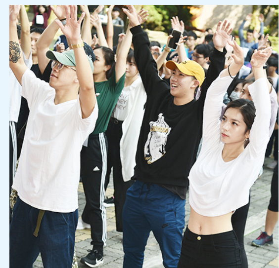
▲健康與健身全球都熱門，文大運健系新生註冊率年年逼近百分百，呼應了年輕人對職涯趨勢

健康紅不讓，運健系人氣強強滾 今年 8 月初文化大學成立了第 13 個學院「體育運動健康學院」，就是看到了「全民運動」、「一定要健康」的熱潮，疫情帶來的正向啟發也在於此，不論強身健體或長照 2.0，都指向「運動健康」是高齡化社會必然的長紅產業。文大運動與健康促進系國內考生註冊率連年逼近百分百，也印証了考生意向、學校育才和產業連結三者間的緊密關聯。正值熟齡的文化大學，不僅重視歷久彌新的學習主題，面對創新領域也絕不缺席，努力為大學教育勾勒出藍圖完整的「新文化」！