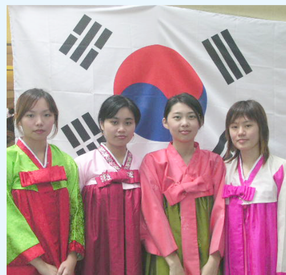
▲文大韓文系今年大一新生比去年增加 7 成，熱度居高不下

金融、數據運用，雙強鼎立 商學院中，財金和資管系由於專業性清晰，全球數位金融科技和數據運用不斷演進，未來職涯魅力大增，牢牢吸引新鮮人；財金系金融行銷組三年平均註冊率超過 9 成 8。