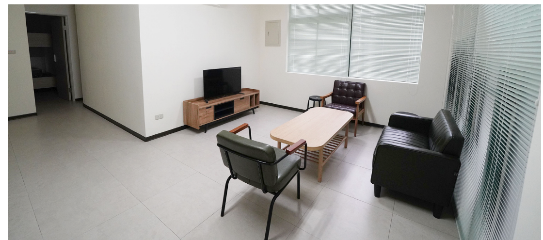
▲文大老屋新造改建文青風宿舍，有獨立的客廳、廚、衛，為國際學人營造家的感覺。