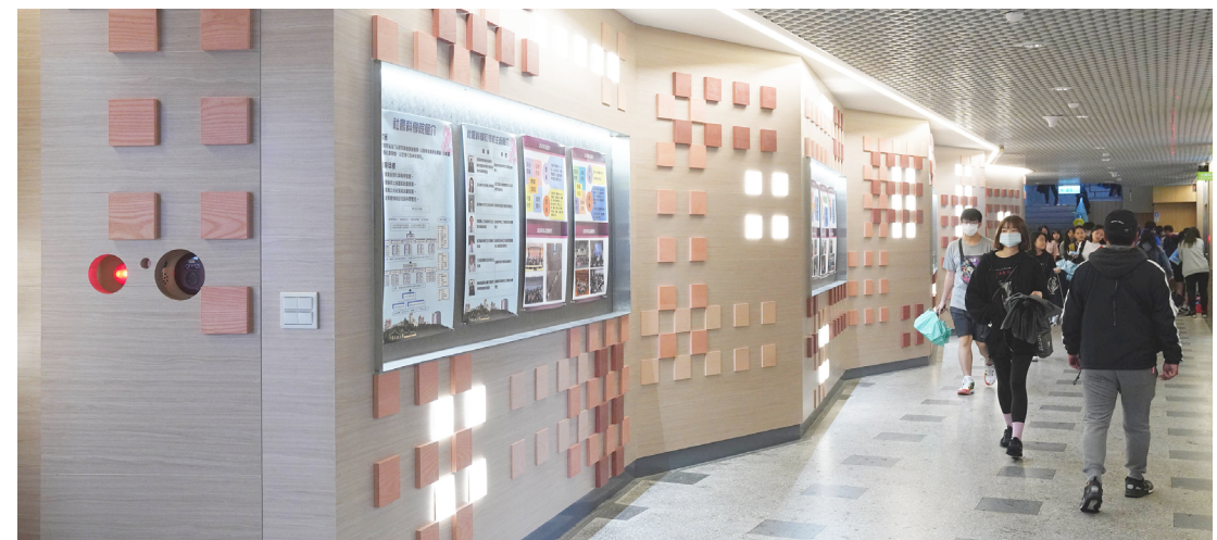
▲力拚少子化海嘯 文大改造館樓展現銳變新風貌