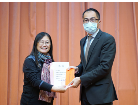
法律學系企業金融法制組註冊率 98.00%