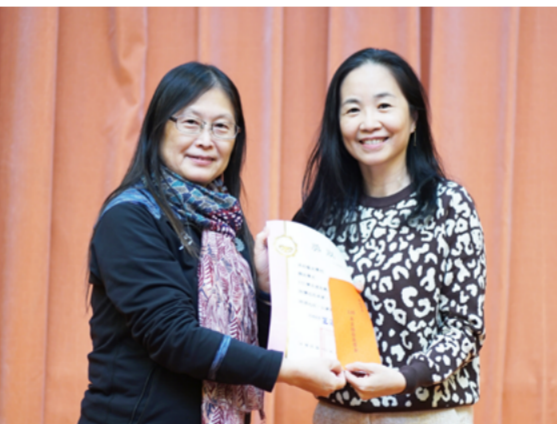
舞蹈學系和技擊國術學系註冊率進步幅度最高，各獲得 5 萬元之獎勵金

養科技與人文素養兼備之跨領域人才，期待能學習更完整且連結人的溫度與關懷的學習精神。 大會共同主席，宜蘭大學游竹院長指出，今年 IET CETA 研討會主題為「從工程技術到跨領域創新」，其研究文章範圍主要包括如下：SDGs 永續發展、科技藝術與教育之創意應用、工程於傳播之分析應用、傳播科技應用、資訊在文學之應用、資訊於社會科學之討論、資訊於精準健康之應用、智慧農業之創新設計、大數據分析與應用等。 王翔郁主任指出，透過為期兩天會議，舉辦 13 場議程、8 場口頭發表、2 場海報論文發表、2 場的專題演講以及 1 場產業論壇，成果豐碩。