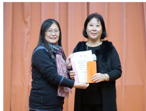
韓國語文學系註冊率 97.14%