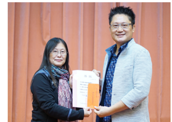
運動與健康促進學系註冊率 96.00%