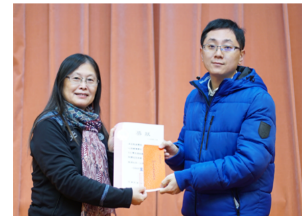
心理輔導學系註冊率 98.31%