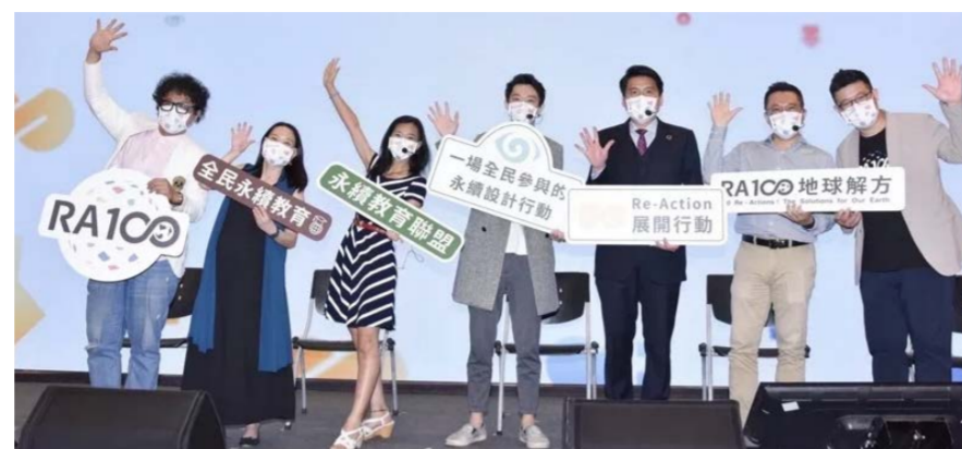
【文/轉貼自聯合線上倡議家】

近年來，永續浪潮席卷全球！當 16 歲的瑞典少女環保鬥士童貝里 (Greta Thunberg) 站上聯合國講台抗議世界領導者忽視氣候變遷、世界大學影響力排名越來越看重大學對於社會永續發展的培養與投資、美國永續人才平均年薪達台幣 250 萬元，台灣的企業卻面臨大規模的「永續人才荒」...此時，台灣的高等教育界應該做出哪些變革，才能真實回應時代的需求？