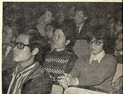
△李爾王劇團於國立藝術館演出。時衆觀神注的觀劇賞情。