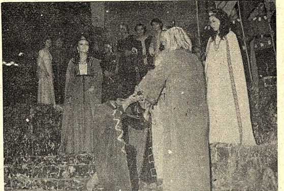
△公位二爾瓦康與尼本奧子授冠皇把，爾李的齡高五九△得的時狀此見人夫爵公的獎貧、偽虛、薄刻那為旁，爵。態神意

角由康靈扮演，這由他演，引起了不少觀眾的笑聲，有一位小妹妹看完李劇一後就表示，她最喜歡的角色是傻瓜。 演肯特的忠心，大公主的虛偽和貪婪，二公主的吝嗇和刻薄，三公主的坦白與格勞勃斯王子爵的忠厚，這些角色都很適切的表現了「李」劇裏流動的人性，以及所表達的親子關係的主題意識。