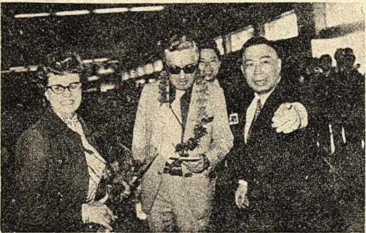
圖說說明：(左)賓州李海大學副校長齊蘭懋博士與夫人，(右)賓州李海大學副校長齊蘭懋博士與夫人，(中)賓州李海大學副校長齊蘭懋博士與夫人，(右)賓州李海大學副校長齊蘭懋博士與夫人。