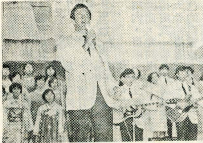
美籍團員唱歌時的神情

編者的話 △本報為中國文化學院新聞系實習報，其目的在使學生理論與實際相互配合，以增加學習效果。 △本報報導文化學院校內新聞，星期日休刊，寒暑假改出週刊。 △為使本報更能名實相符，今日起更名為「華夏導報」，特此敬告讀者。