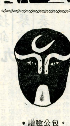
· 譜臉公包 ·