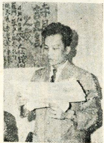
圖上：院長陪同教育督學視察本校，圖下：桂冠詩人羅門在詩誦大會中朗誦的神情。

【本報訊】海洋研究所所長關世傑，頃向海軍總司令部接洽，換贈本校貴重航海器材一批。器材包括有：磁羅經二個、電羅經一個、測程儀一個，不日即可運交使用。