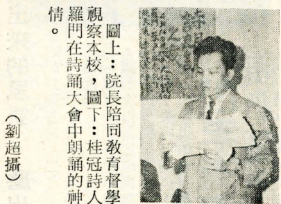
圖上：院長陪同教育督學視察本校，圖下：桂冠詩人羅門在詩誦大會中朗誦的神情。

【本報訊】中華學術院海洋研究所月一日，自日本啟程前來華岡。檜山博士將於下月一日，自日本啟程前來華岡。檜山博士將於下月一日，自日本啟程前來華岡。