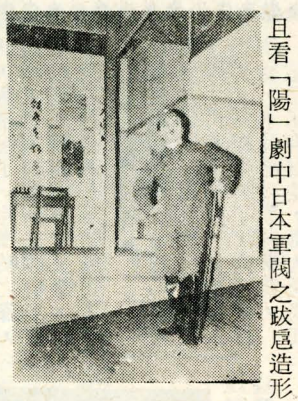
且看「陽」劇中日本軍閥之跋扈造形

計十室卅一人獲獎 【本報訊】本校訓練處於上星期四所舉行的內務整潔競賽，成績業已揭曉。 團體成績優良者包括：大倫館三三七、三五五、二〇