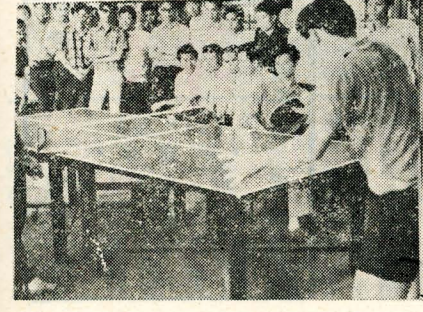
冠軍頭銜今日揭曉

【本報訊】桌球錦標賽二十六日中午，繼續在體育場激戰，結果海洋系以三比二取勝，此項比賽，原定今日結束，冠軍頭銜