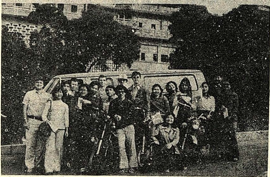
△圖爲基督教研究所寒暑假福音隊。