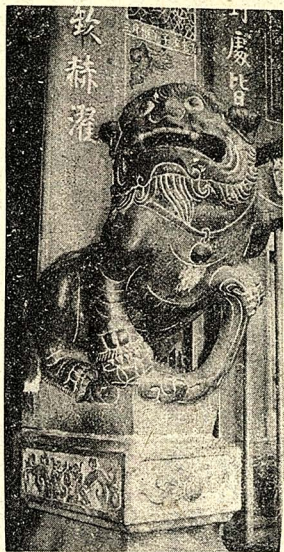
福祜宮嘉慶年間造之石獅

祖師廟中還供奉「米市王爵」(也稱「西秦王爵」)，此廟的原神是「米市王爵」，為供奉祖師爵，乃改為「清水巖祖師廟」。