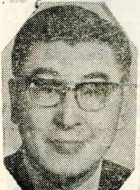
現年六十二歲的崖先生，滿面紅光，高大健壯，為人所羨，張實事求是，他恬淡不願名利的性格，對別人沒有過多的干涉。

哲學研究所主任崖先生，吉林長春人，北京大學、清華研究院畢業，博學多能，曾任參政員、委員、秘書長、所長、教授等職。 現年六十二歲的崖先生，滿面紅光，高大健壯，為人所羨，張實事求是，他恬淡不願名利的性格，對別人沒有過多的干涉。